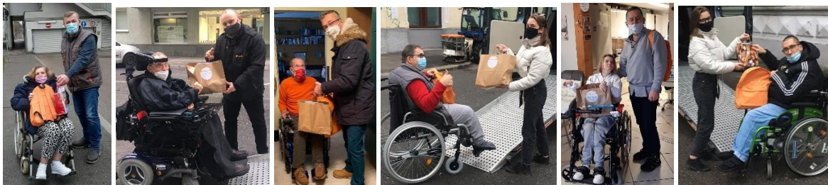
Bilder oben: Allen CBMF-Mitgliedern wurden persönlich Weihnachtsgeschenke überreicht

Ich bedanke mich bei allen haupt- und den vielen ehrenamtlichen CBMF-MitarbeiterInnen für das Besorgen und liebevolle Verpacken der vielen Geschenke und die persönliche Zustellung an alle Mitglieder. Ebenso bedanke ich mich bei der August Herzmansky'schen Stiftung , die für einen Teil der Weihnachtsgeschenke die Kosten übernommen hat. Weiters bedanke ich mich beim Fahrtendienstunternehmen Waka , welches uns nicht nur logistisch beim Ausliefern der Weihnachtspakete half, sondern unsere Weihnachtsgeschenke mit Sachspenden, wie Rucksäcke, Geschenksackerln, Traubensäften, Lebkuchen, Tee und Teetasse, unterstützte.